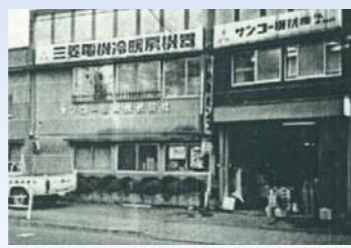
サンコー機材株式会社に社名変更